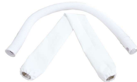
Tömlő + bőr tok